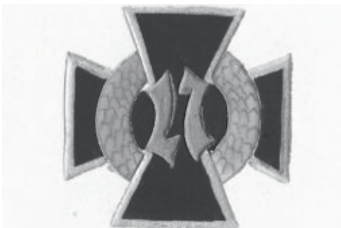
Jääkärimerkki on tehty siten, että luvun 27 voi lukea kummin päin tahansa – Valok. Jorma Ignatiuksen kokoelmaan kuuluvasta postikortista (osa)

Ignatius oli tuonut mukanaan katseltaviksemme osan Lockstedt-kokoelmastaan, joka käsittää lähinnä postikortteja ja muita dokumentteja. Seinälle hän oli ripustanut Lockstedtin leirin alueen puuvillakankaalle liimatun kartan vuodelta 1910. Todennäköisesti tämä saksalaisella täsmällisyydellä tehty kartta on ollut taskussa myös jääkäreillä, sillä se on tietävästi ainoa painos.