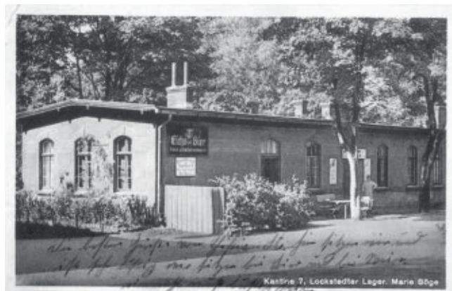
Kanttiini numero 7.