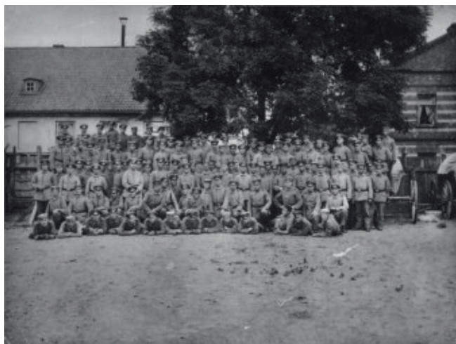
Kuninkaallisen Preussilaisen Jääkäripataljoona 27:n karjalaiset ottivat kesällä 1917 yhteisen kuvan Libaussa