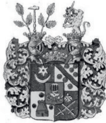
Silfverhjelmien vaakuna - Valok.

miehellä piti olla koko ajan kivääri ampu-mavalmiudessa. Eräs silloinen huvittelu-muoto oli susien ampuminen, sillä susia oli paljon, koska niille riitti ruokaa taistelu-maastossa.