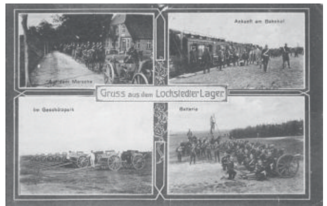
Vuonna 1914 kulkenut postikortti, jossa kuvataan jääkäreiden saapumista Lockstedtin asemalle sekä elämää leirillä.