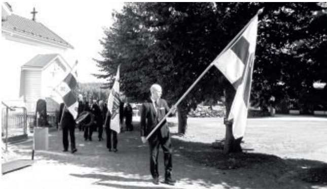
Lippukulkue