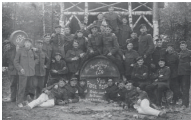
Postikortti saksalaisten kotiuttamisjuhlasta: ”Juokaa veljet – panimo tarvitsee tyhjiä tynnöreitä.”

Ensimmäinen vierailu, minkä jääkärit dokumenttien mukaan tekivät, suuntautui Kaiser-Wilhelm-kanalille ja Hampuriin Reeperbahnille teatteriin katsomaan Lentävää Hollantilaista. Toukokuusta alkaen myönnettiin myös lyhyitä lomia, jolloin jääkärit saattoivat tutustua Saksaan – Suomeen ei ollut mahdollista tulla. Vaikka tuohon aikaan saksalaisissa sotilaskanttiineissa olutta ei pidetty alkoholijuomana vaan elintarvikkeena, kaikki alkoholituotteet ja tupakka kiellettiin jostakin syystä suomalaisilta. Syytä voi vain arvailla.