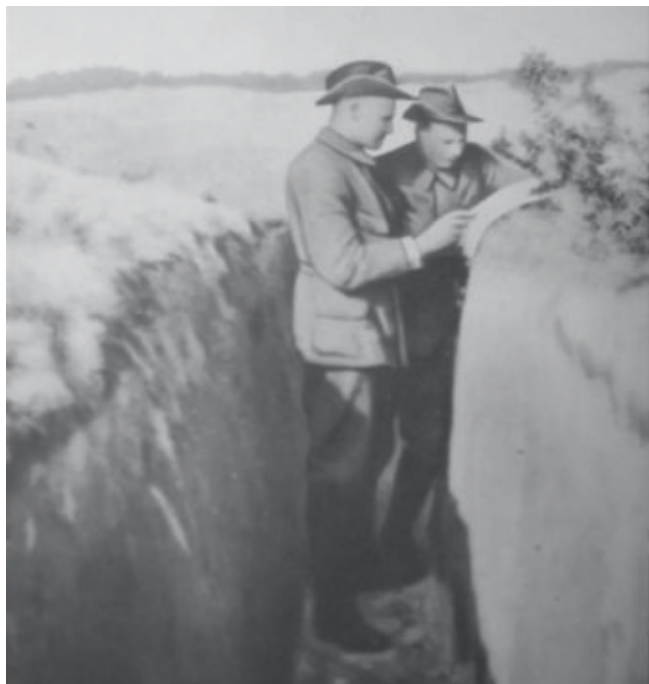
Harvinainen kuva partioasuisista suomalaisista leirillä.

Elokuussa 1915 suomalaisista muodostettiin Ausbildungstruppe Lockstedt, johon keisari Wilhelm II oli hyväksynyt otettavaksi jopa 2 000 miestä. Lockstedtissä koulutettiin lopulta yhteensä 1 897 suomalaista. Virallinen nimi Königlich Preussisches Jägerbataillon Nr. 27 annettiin pataljoonalle toukokuussa 1916.