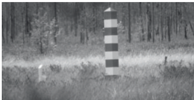
Suomen sinivalkoinen rajapaalu.

Olin Hattuvaaralla yhdessä Ilmari ja Telleruvo Ojalan kanssa, ja menimme sinne perjantaina. Lauantai käytettiin kiertelemällä vanhoja taistelupaikkoja. Nykyisin alueella on lukuisia muistomerkkejä kertomassa tapahtumista 69 vuotta sitten. Tärkeä paikka on myös Suomen ja ehkä Euroopan unionin itäisin piste, minne on pystytetty paalu merkiksi. Edessä on kaunis järvi, ja järven keskellä olevassa saarella on molempien valtakuntien rajapaalut, Suomen sinivalkoinen, Venäjän punavihreä.