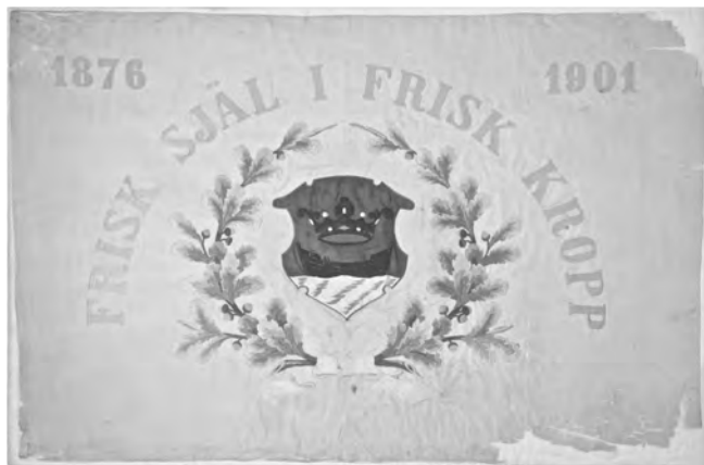
Venäläisten keskuudessa pahennusta herättänyt naisvoimistelijoiden lippu

Sille venäläiset eivät kuitenkaan voineet mitään, että suomalaiset voittivat 9 kultaa, 8 hopeaa ja 9 pronssia Venäjän voittaessa vaivaiset 2 hopeaa ja 2 pronssia. Erityisesti Hannes Kolehmainen juoksi Suomen maailmankartalle kolmella voitollaan.