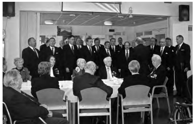
Mestari-Laulajien kuoro sekä kutsuvieraita