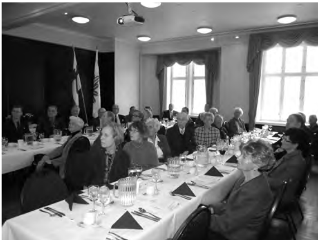
Kiinnostuneita kuulijoita

A nton Eskolan esitelmä puolustusvoimien joukko-osastojen perinnepäivävalintojen sotahistoriallisesta taustasta keräsi Ostrobothnian täyteen kiinnostuneita kuulijoita ystäväpäivänä 14.2.2012. Eskola aloitti esityksensä kuvaamalla kattavasti koko perinnekehtää. Puolustusvoimain komentaja vahvistaa Pääesikunnan henkilöstöosaston esityksestä joukko-osastolle nimen, vuosipäivän, kunniamarssin ja lipun. Joukko-osaston vastuulle voidaan myös määrätä joidenkin sitä edeltävien organisaatioiden perinteitä talvi- ja jatkosodan ajalta ja jopa aikaisempiakin, sekä perinnetaiteluita. Myös joukko-osastotunnuksen ja tunnusvärien voidaan katsoa kuuluvan virallisiin sotilasperinteisiin.